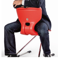
Schalenform erlaubt verschiedene Sitzpositionen, auch beim umgekehrten Sitzen