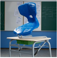
Plattenschoner schützen den Tisch beim Aufstuhlen