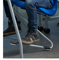
Robustes Z-Form Gestell mit ASS FLOORSAFE® Bodenschoner