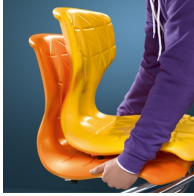
2 Stühle stapelbar sowie leichtes Tragen durch geringes Gewicht