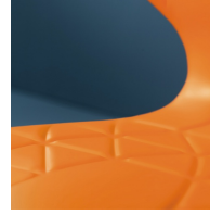
Sitzschale mit integrierten Lüftungskanälen