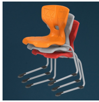
Bis zu 3 Stühle stapelbar (ohne Polster)