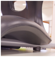
Plattenschoner schützen den Tisch beim Aufstuhlen