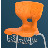
Optional mit Buchablagekorb ab Größe 5