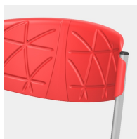
Absolut robustes Gestell