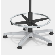
Robustes Alu-Fußkreuz mit Erhöhung und verchromtem Fußring, höhenverstellbar