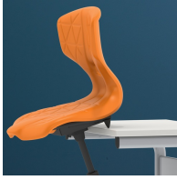
Tischaufhängung schützt den Tisch beim Aufstehen