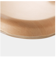
Optional WOODMARK Tischplatte in bruchfester Qualität