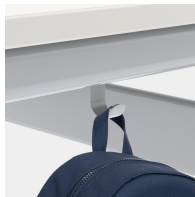
Inklusive einem Mappenhaken je Sitzplatz