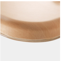
Optional WOODMARK Tischplatte in bruchfester Qualität