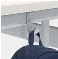
Inklusive einem Mappenhaken je Sitzplatz