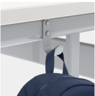
Inklusive einem Mappenhaken je Sitzplatz