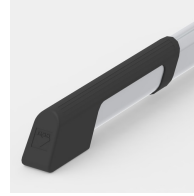
Bodenschoner mit integriertem Trittschutz