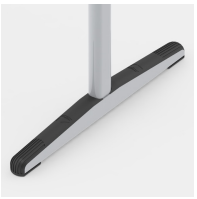
Bodenschoner mit durchgehendem Trittschutz