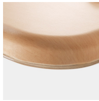
Optional WOODMARK Tischplatte in bruchfester Qualität