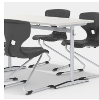
Durch Mittelsäulengestell beidseitig bestuhlbar