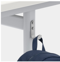
Inklusive einem Mappenhaken pro Sitzplatz