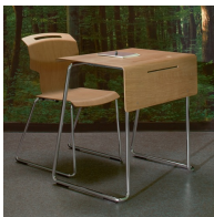
Schlanker Querschnitt und modernes Design