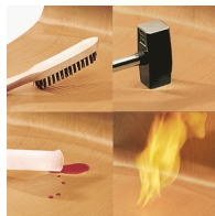
Unverwüsthche PAGHOLZ®-Platte, kratz-, bruch-, stoßfest & schwer entflammbar