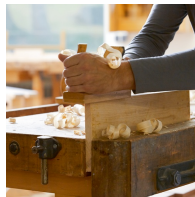
Massives Buchenholz aus nachhaltiger Forstwirtschaft