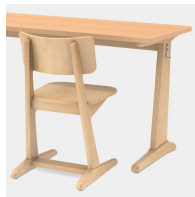
Durch C-Form kein Stören der Tischbeine beim Ein- und Aussteigen