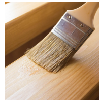
Umweltfreundlich mit Lack auf Wasserbasis lackiert.