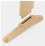
Langlebige und robuste Konstruktion: Fest verzapft und verleimt