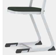
Stabiles und massives C-Form Kufengestell