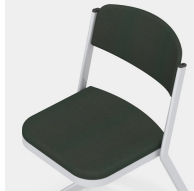
Mit Sitz- und Rückenpolster