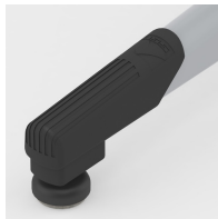
Bodenschoner mit integriertem Trittschutz und Neviausgleich