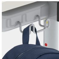
Inklusive einem Doppel-Mappenhaken pro Sitzplatz