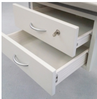
Inklusive abschließbarem Schulbadenunterschrank