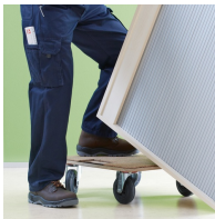
Korpus ab Werk fest verdübelt und verleimt für schnellen Aufbau vor Ort