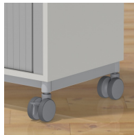
Rollladenschrank optional fahrbar mit Rollen