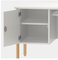
Unterschrank inkl. einem Fachboden, mittels Sicherheitsschloss abschließbar