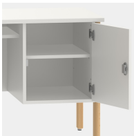
Unterschrank inkl. einem Fachboden, mittels Sicherheitsschloss abschließbar