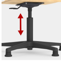
Höhenverstellung durch Sicherheitsgasfeder