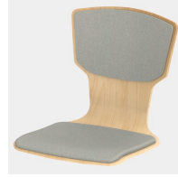
Optional mit Sitz- und Rückenpolster