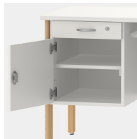
Unterschrank inkl. Schublade, mittels Sicherheitsschloss abschließbar