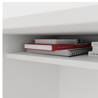
Inklusive praktischer Ablage