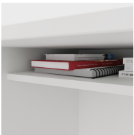
Inklusive praktischer Ablage