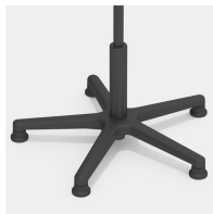
Absolut robustes Kunststoff-Fußkreuz in schwarz