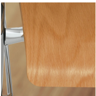
Sitzschale umweltfreundlich lackiert mit Lack auf Wasserbasis