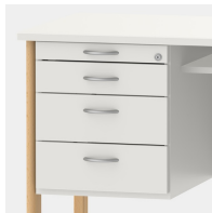
Unterschrank inkl. Utensilienauszug und Schubladen mit Einzugsdämpfung und Zentralverschluss