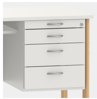
Unterschrank inkl. Utensilienauszug und Schubladen mit Einzugsdämpfung und Zentralverschluss