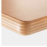
Optional Tischplatte Multiplex melaminharzbeschichtet