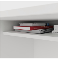
Inklusive praktischer Ablage