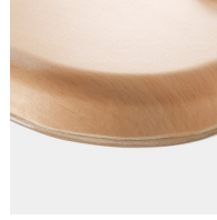
Optional WOODMARK Tischplatte in bruchfester Qualität