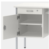
Unterschrank inkl. Schublade, mittels Sicherheitsschloss abschließbar