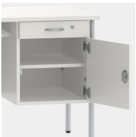
Unterschrank inkl. Schublade, mittels Sicherheitsschloss abschließbar