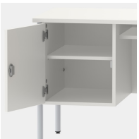
Unterschrank, inkl. einem Fachboden, mittels Sicherheitsschloss abschließbar