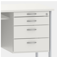
Unterschrank inkl. Utensilienauszug und Schubladen mit Einzugsdämpfung und Zentralverschluss