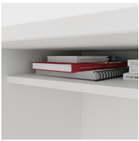
Inklusive praktischer Ablage