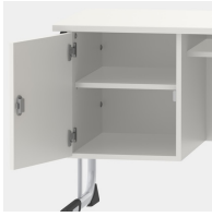
Unterschrank, inkl. einem Fachboden, mittels Sicherheitsschloss abschließbar