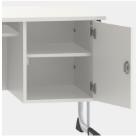
Unterschrank, inkl. einem Fachboden, mittels Sicherheitsschloss abschließbar