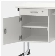
Unterschrank inkl. Schublade, mittels Sicherheitsschloss abschließbar