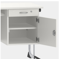
Unterschrank inkl. Schublade, mittels Sicherheitsschloss abschließbar