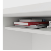
Inklusive praktischer Ablage