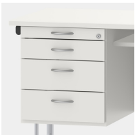
Unterschrank inkl. Utensilienauszug und Schubladen mit Einzugsdämpfung und Zentralverschluss