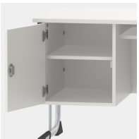
Unterschrank, inkl. einem Fachboden, mittels Sicherheitsschloss abschließbar