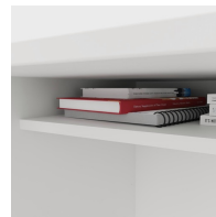
Inklusive praktischer Ablage