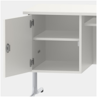
Unterschrank, inkl. einem Fachboden, mittels Sicherheitsschloss abschließbar