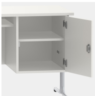
Unterschrank, inkl. einem Fachboden, mittels Sicherheitsschloss abschließbar