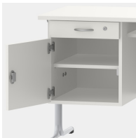
Unterschrank inkl. Schublade, mittels Sicherheitsschloss abschließbar