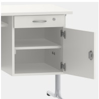
Unterschrank inkl. Schublade, mittels Sicherheitsschloss abschließbar