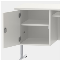
Unterschrank, inkl. einem Fachboden, mittels Sicherheitsschloss abschließbar