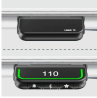
Handschalter mit Auf- und Ab-Funktion oder optional mit Memoryfunktion