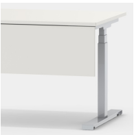
Passendes Zubehör: Frontblende Modell 2050.182