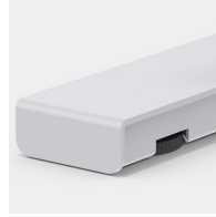
Bodenschoner mit Niveauegleich zum einfachen Ausgleichen von Bodenunebenheiten