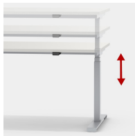
Stufenlos und leise höhenverstellbar im Bereich von 62-127 cm