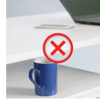
Kollisionsschutz minimiert das Risiko von Schäden beim Auf- und Abfahren