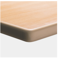
Optional Tischplatte melaminharzbeschichtet mit ASSODUR®-Kante