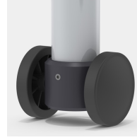
Optional Gestell fahrbar mittels 2 Bockrollen