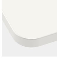
Optional Tischplatte mit 40 mm Eckradius