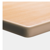
Optional Tischplatte melaminharzbeschichtet mit ASSODUR®-Kante