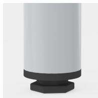
Bodenschoner mit Niveaueausgleich: gleicht Bodenunebenheiten aus