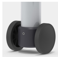
Optional Gestell fahrbar mittels 2 Bockrollen