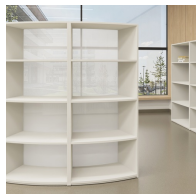
Rückwand aus transluzentem Acrylglas