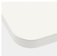
Tischplatte mit 40 mm Eckradius