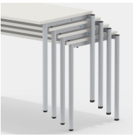
Durch besondere Gestellkonstruktion bis zu 4 Tische stapelbar