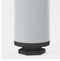
Bodenschoner mit Niveauegleich: gleicht Bodenunebenheiten aus