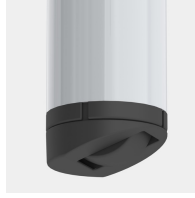
Optional Gestell fahrbar mittels 2 Rollen