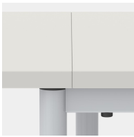
Tischplatten fugenlos aneinander stellbar