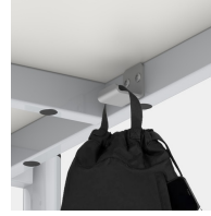
Optional mit einem Mappenhaken je Sitzplatz